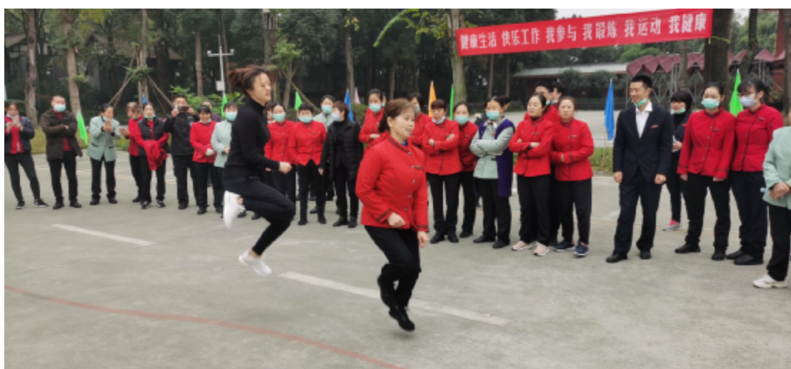
厨房队获得团体跳绳第一名