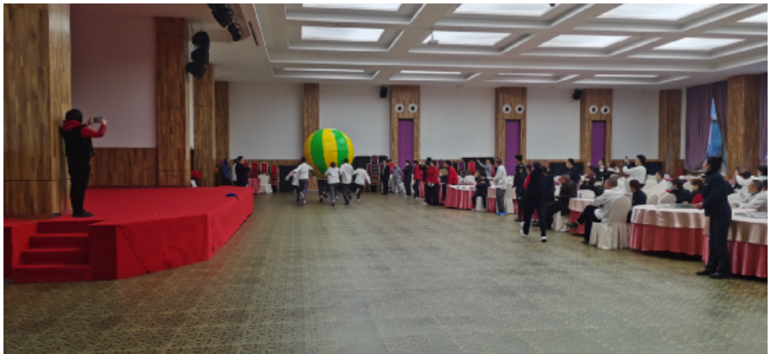
厨房队获得运转乾坤球第一名