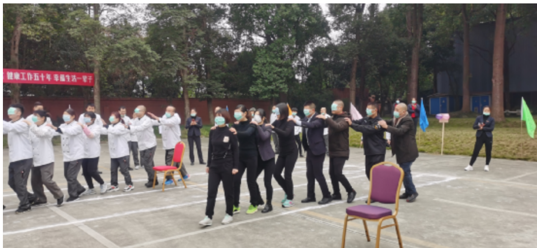
综合经营部获得瞎子指路第一名