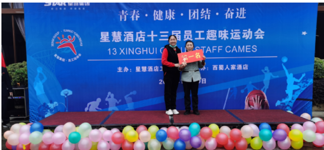
后勤联队获得 25 米托盘接力赛第一名