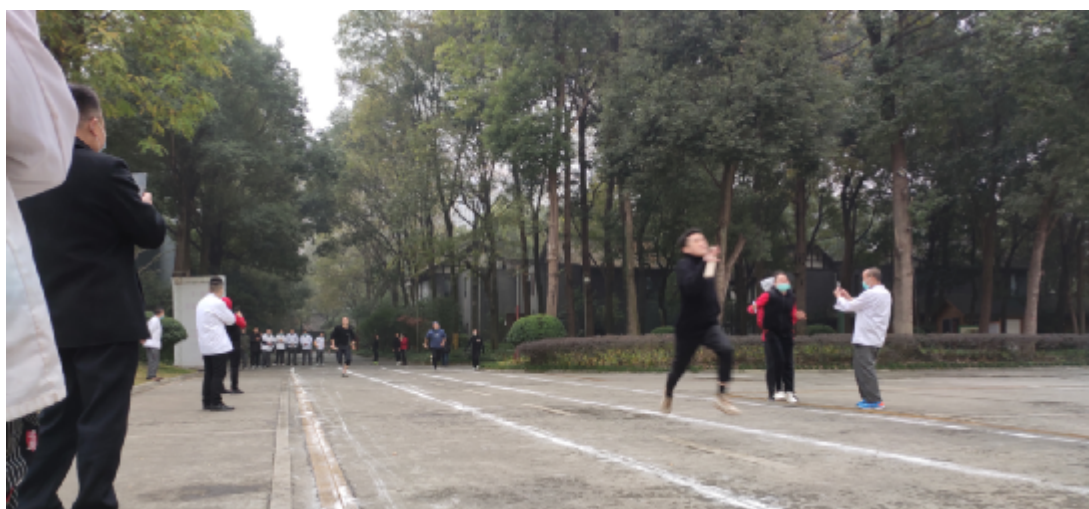
综合经营部获得4*50米接力赛第一名