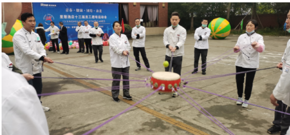
综合经营部获得鼓动人心第一名