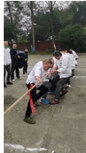
后勤联队获得拔河比赛第一名